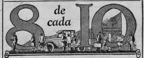
La Casa más Grande del Mundo en la Construcción de Automóviles de Calidad.

CON cifras se ha probado que 8 de cada 10 dueños de Studebaker, vuelven a comprar Studebaker cuando necesitan un automóvil nuevo.